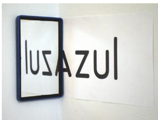
Obra de l'artista argentí Augusto Zanela