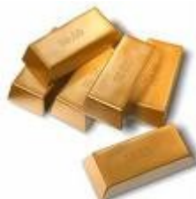
Castellà – 1 paraula