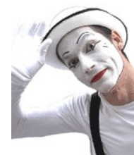
Català – 1 paraula