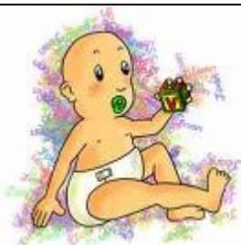
Català – 1 paraula