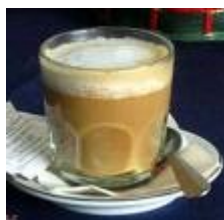
Català – 1 paraula