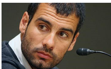
Català – 1 paraula