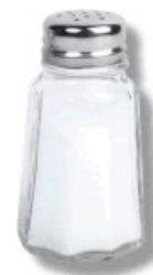
Català/castellà – 2 paraules