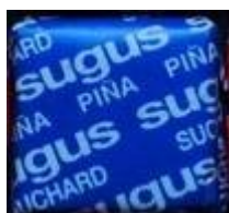
Català/castellà – 1 paraula