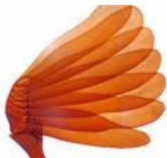
Català/castellà – 1 paraula